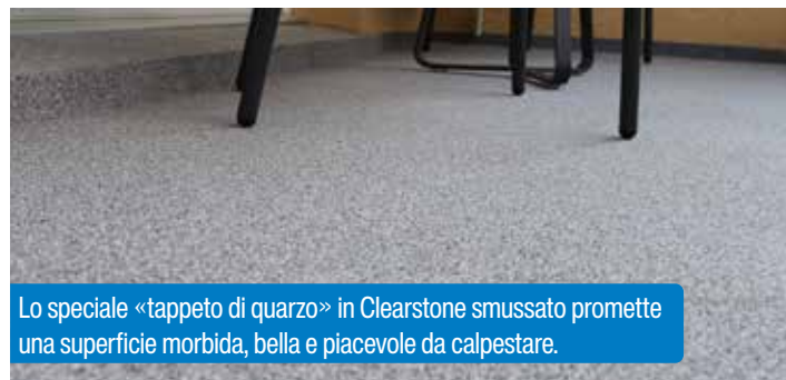
Lo speciale «tappeto di quarzo» in Clearstone smussato promette una superficie morbida, bella e piacevole da calpestare.

Il committente ha scelto il sistema per balconi Alsan SolaFloor Decotop CS (Clearstone) di SOPREMA AG. Questo meraviglioso «tappeto di quarzo» di elevata qualità si adatta perfettamente alle suite appena ristrutturate: il rivestimento dal forte valore estetico è molto comodo e, grazie al quarzo appositamente rettificato, estremamente piacevole al calpestio anche a piedi nudi.