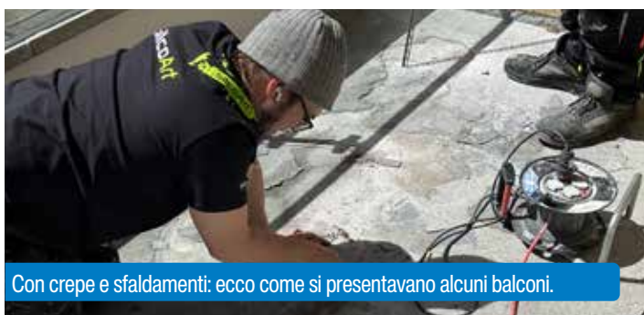
Con crepe e sfaldamenti: ecco come si presentavano alcuni balconi.

Il Grand Resort Bad Ragaz è un complesso elegante, raffinato e lussuoso composto da due Grand Hotel, una stazione termale, un golf club, un casinò e un centro di salute e nutrizione. La struttura fa parte del gruppo Leading Hotels of the World e comprende 98 suite. Nel 2019 questo resort unico nel suo genere è stato sottoposto a una completa opera di ripristino e ristrutturazione. Le camere, arredate con stile, dispongono tutte di un balcone da cui gli ospiti possono godere della splendida vista sui giardini e sulle montagne circostanti. Anche questi balconi iniziavano a mostrare i segni del tempo, con rivestimenti compromessi da scheggiature e crepe, e una prima fase ha previsto il risanamento di 26 unità.