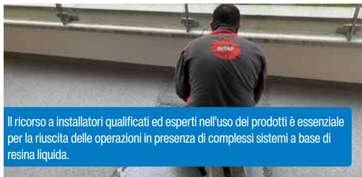
Il ricorso a installatori qualificati ed esperti nell'uso dei prodotti è essenziale per la riuscita delle operazioni in presenza di complessi sistemi a base di resina liquida.

Il sistema Decotop è stato utilizzato per realizzare una membrana impermeabilizzante fibrorinforzata, sopra la quale è stato applicato lo strato calpestabile di alta qualità e in linea con l'estetica della struttura: un «tappeto di quarzo» liscio con una speciale sabbia di quarzo smussata.