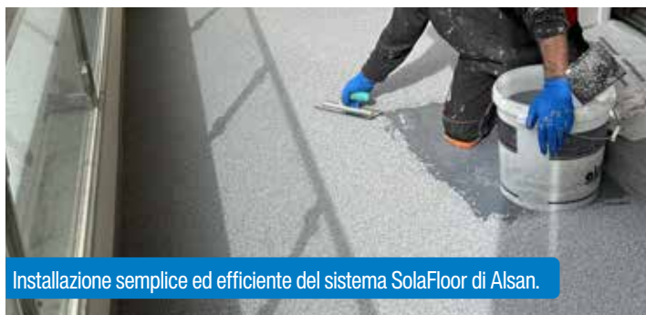
Installazione semplice ed efficiente del sistema SolaFloor di Alsan.

Il sistema per balconi Alsan SolaFloor Decotop CS è stato in grado di soddisfare anche questi requisiti. Il sistema poliuretano monocomponente ad alte prestazioni può essere applicato senza problemi su fondi opachi e umidi, poiché la sua resina funzionale è permeabile al vapore e permette la dispersione dell'umidità. Il sistema si distingue per un tempo di indurimento rapido e non teme i cambiamenti atmosferici improvvisi accompagnati da pioggia.