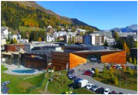
Centro congressi, Davos