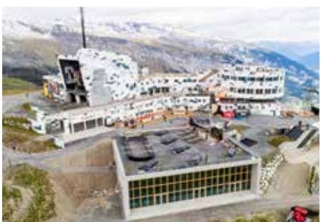
Hangar moderno sul Crap Sogn Gion, Laax