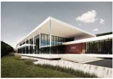
Centro di produzione di IWC, Sciaffusa