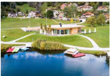
Ustria Lags, Laax