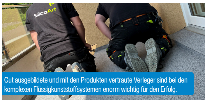
Gut ausgebildete und mit den Produkten vertraute Verleger sind bei den komplexen Flüssigkunststoffsystemen enorm wichtig für den Erfolg.

Mit dem Decotop System wurde eine faserarmierte Abdichtungsmembrane erstellt, worauf die dekorativ passende und hochwertige Nutzschiicht, ein «Quarzteppich» mit speziellem, rund geschliffenem Quarzsand eintalochiert wurde.