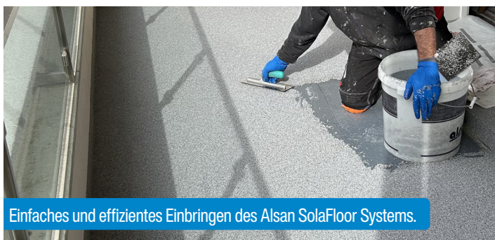
Einfaches und effizientes Einbringen des Alsan SolaFloor Systems.

1K-System auf Polyurethanbasis kann bedenkenlos auf matt feuchte Untergründe appliziert werden, da das funktionstüchtige Harz diffusionsoffen ist und eingeschlossene Feuchtigkeit entweichen kann. Es hat eine schnelle Aushärtungszeit und spontane Wetterumschwünge mit Regen können ihm nichts anhaben.